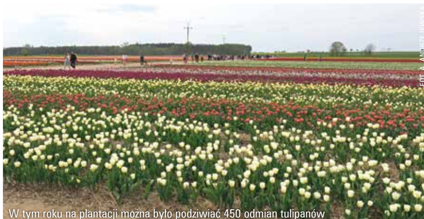
W tym roku na plantacji można było podziwiać 450 odmian tulipanów

z niego symbol rozslawiający nasz kraj na arenie międzynarodowej. Nadawanie nowym odmianom nazw polityków i innych sławnych Polaków ma wymiar patriotyczny. Prelegentka stwierdziła, że mimo obecności polityków majówka