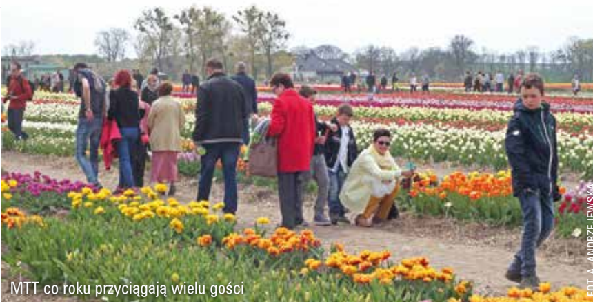
MTT co roku przyciągają wielu gości