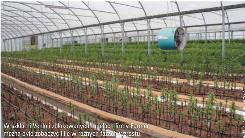
W szklarni Venlo i zblokowanych tunelach firmy Farmer można było zobaczyć lilie w różnych fazach wzrostu